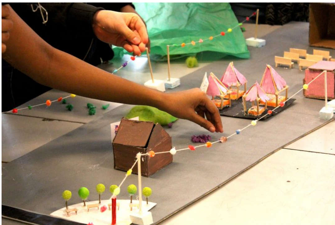
Scen, restaurang och marknadsstånd vill klass 8B att det ska finnas på torget.